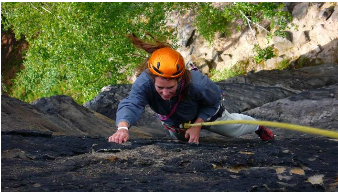
| Lolaturm Südwestwand.